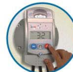
Teclas sensíveis ao toque Piezo keypad technology Teclas sensibles a lo toque