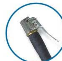
Bico com trava Clip-on chuck Pica con trava